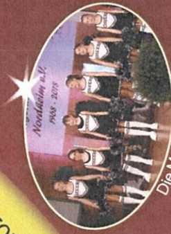
Nordheim e.V. 1988 - 2019 Die Mainschleifen