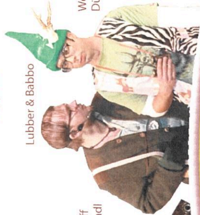
Lubber & Babbo